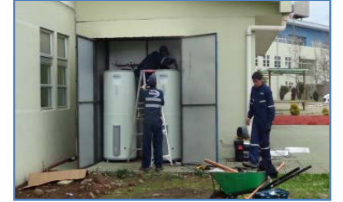
Instalación de Termos de Agua Caliente en Baños de Personal de Mantenición.