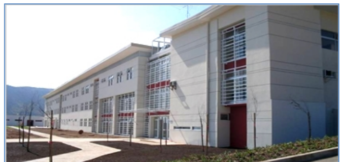
Establecimiento Penitenciario de La Serena

De acuerdo al DS N° 271 del 13.09.13 se modifican las capacidades máximas de los Establecimientos Penitenciarios a un 140%