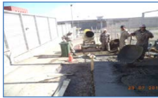
Trabajos filtración de agua acceso a zona interna.