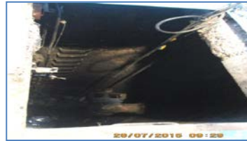
Mantenimiento de Planta Elevadora de Aguas Servidas

Se independizó el suministro de agua caliente de la Central de Alimentación Externa (CAE) y baños del personal de la Concesionaria, con la instalación de 2 termos industriales eléctricos de 500 litros cada uno; de esta manera las calderas no suministrarán más agua caliente a estas áreas, por tanto el remarcador de agua caliente correspondiente a esta zona no registrará consumo dado que quedará fuera de servicio.