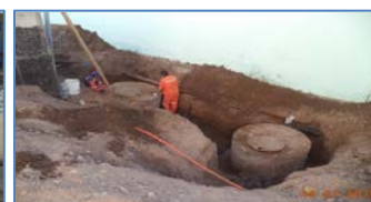
Trabajos de recuperación de cámara y asentamiento en Área 10, entre Módulo Terapéutico y Guardia Interna