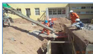
Trabajos de reparación en Edificio de Estadísticas..

Los primeros días de julio, y tras una evaluación respecto del procedimiento y normativa respectiva, la empresa distribuidora de Gas (Lipigas), materializa el cambio de 3 de 8 bombonas de gas licuado, las cuales se encontraban con el término de su vida útil.